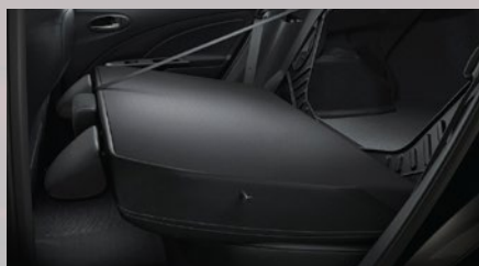
Asiento trasero rebatible.