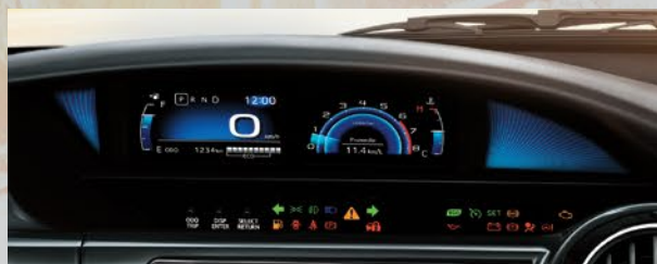
Display de información múltiple digital.