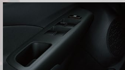
Levantacristales eléctricos en las 4 puertas.