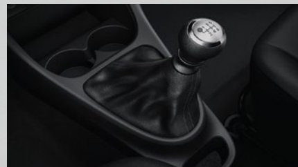
Caja manual de 6 marchas.