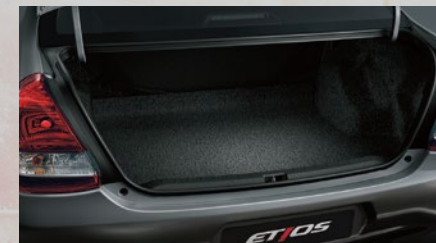
Capacidad de carga de baúl: 562 litros. (4)(5)