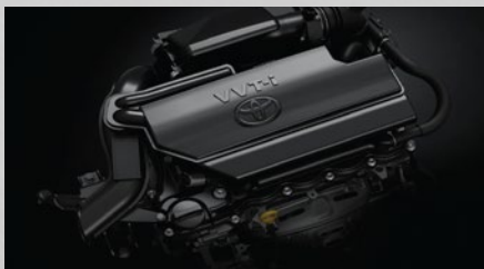
Motor Toyota 2NR-FE, 16 válvulas con sistema dual VVT-i.