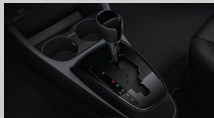
Caja automática de 4 marchas. (3)