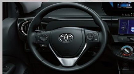
Volante de cuero con control de audio, display de información múltiple y teléfono. (1)