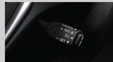
Control de velocidad crucero. (3)