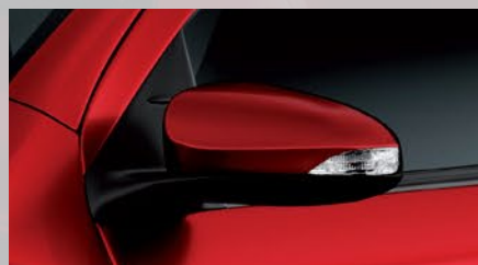
Espejos exteriores con luz de giro incorporada y regulación eléctrica. (1)