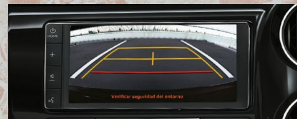
Monitor con cámara de estacionamiento. (1)