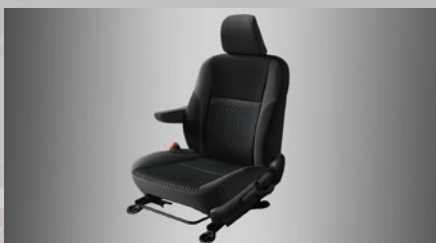
Asiento del conductor con apoyabrazos. (3)