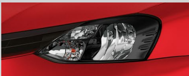
Faros oscurecidos. (1)