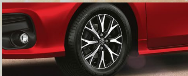
Llantas de aleación diamantadas. (1)