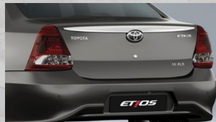
Apertura interior de baúl y tanque de combustible. (4)