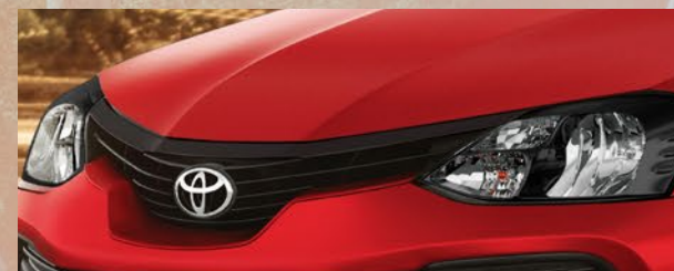
Parrilla con detalle color negro. (1)