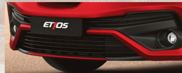
Faros antiniebla delanteros. (1)